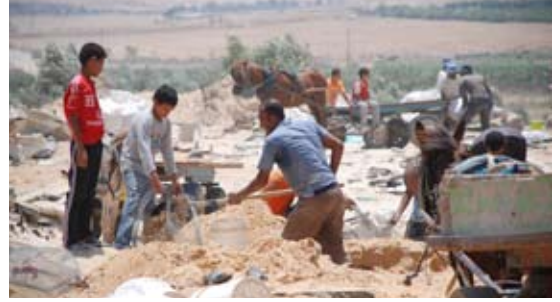
رجال فلسطينيون يجمعون الحصى من المباني المدمرة في غزة وهنا قرب معبر ايريز، على مقربة من المنطقة الامنية الإسرائيلية

أعرب الكثيرون في المجتمع الدولي، بما في ذلك مثل الرباعية السيد/ توني بليز، عن أملهم في أن يؤدي ذلك إلى حدوث تغيير كبير والتخفيف من محنة السكان المدنيين الفلسطينيين في قطاع غزة. 2 ومع ذلك، وبعد مرور خمسة أشهر، كانت هناك علامات قليلة تذكر بشأن حدوث تحسن حقيقي على أرض الواقع لأن 'التخفيف' لم يغير شيئاً في أسس سياسة الحصار غير المشروع. لم تفعل إسرائيل ما يكفي لتخفيف القيود المفروضة على الحياة اليومية لـ 1.5 مليون فلسطيني في غزة، نصفهم من الأطفال.